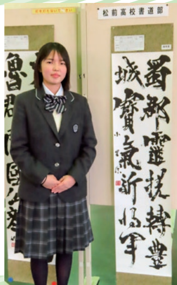
全国高等学校総合文化祭秋田大会(書道部門)に出場(2026年7月)

基礎から応用まで幅広く学べる環境が整っており、選択科目には近代詩文書や応用の書などがあり、自分の関心に応じて学びを深めることができます。また、ワークショップへの参加を通して地域の方々と関わる機会があり、松前町からの支援により充実した環境の中で部活動に励むことができます。そして、作品が評価され、賞をいただく中で達成感や喜びを実感しています。