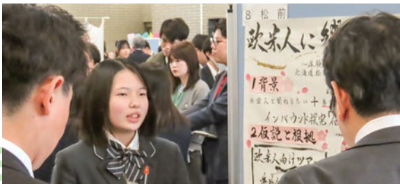
Ezo探究festivalにてグローバル課題探究賞を受賞(2026年1月) 探究テーマ：「欧米人に響く松前の旅」

地域の方々と関わりながら学びを深められる点が魅力です。先生方からの丁寧な助言に加え、他チームとの交流を通して多様な意見を取り入れることで、内容をより充実させることができます。活動を通して、相手に伝わりやすいように考えを整理する力や、自分の関心を熱意をもって伝える発表力が身につきました。さらに、自分たちの提案が実現する経験を通して達成感を得るとともに、自身の成長を実感しています。